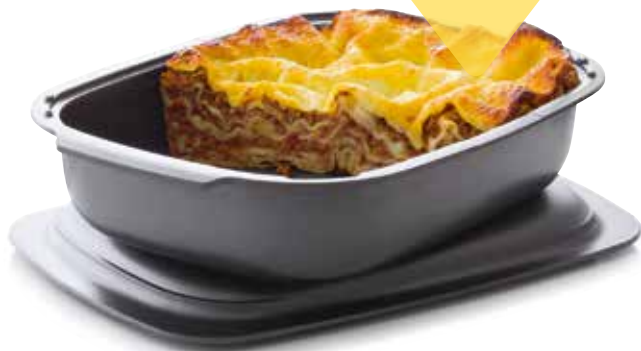
Ultra Pro 3,3 l SS190614