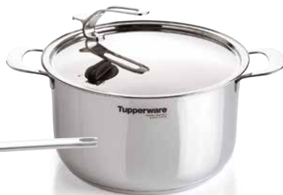
T Chefseries Pure puodas 7,6 l SS190616