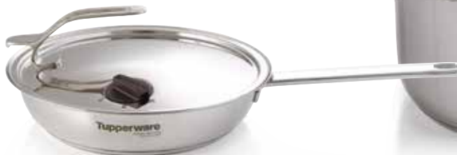
T Chefseries Essential keptuvė 24 cm SS190615