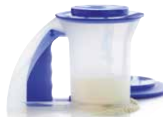
Sijoklis miltams SS190617