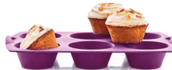
Silikoninė forma keksiukams