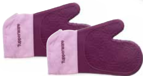
Silikoninė pirštinė (2 vnt.) SS190612