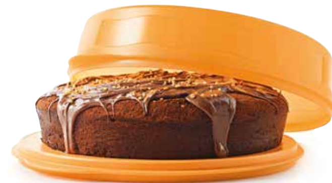
Samba pyraginė SS190619