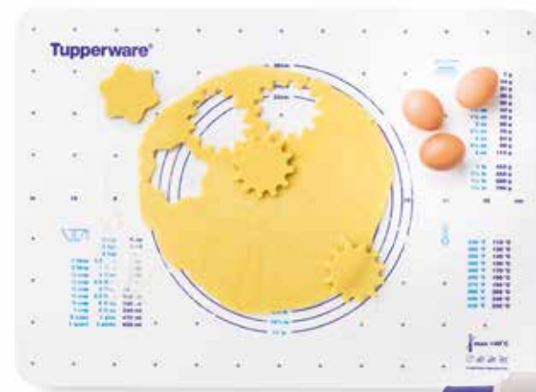
Padėklas tešlos ruošimui Daugiafunkcis kočėlas SS190604