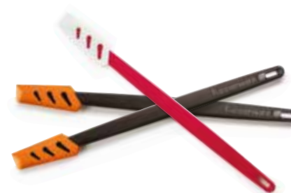
Siauroji silikoninė mentelė SS190620

Įsigykite 2 silikonines menteles ir dar vieną gaukite dovanų