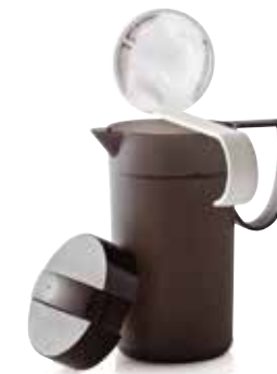
Pieno putų plakiklis