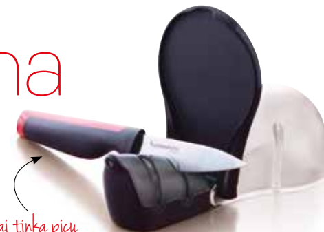
Pjaustymo rinkinys: Peilių galastuvus Sharp Star Universalis peilis SS190613

Puikiai tinka picų ingredientams smulkinėti!