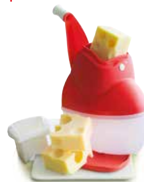
Sūrio malūnėlis SS190601