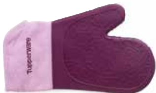
Silikoninė pirštinė SS190625