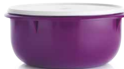
Maišymo dubuo 3 l SS190618